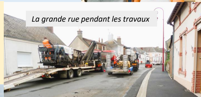
La grande rue pendant les travaux

C'était aussi la rentrée pour les ouvriers de l'entreprise Flécharde qui travaillent à l'aménagement de notre centre bourg. Tous les trottoirs de la grande rue depuis l'école jusqu'au commerce sont finis, le plateau de l'école a aussi été réalisé et les marquages sont finalisés.